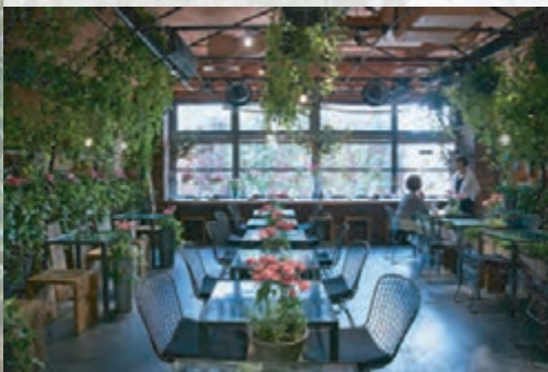
青山フラワーマーケット ティーハウス